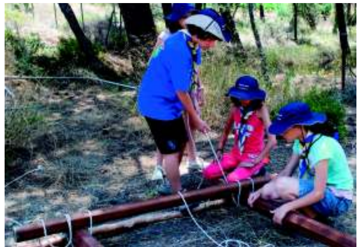
Κατασκευή Πλαισίου Γεφυροποιείας