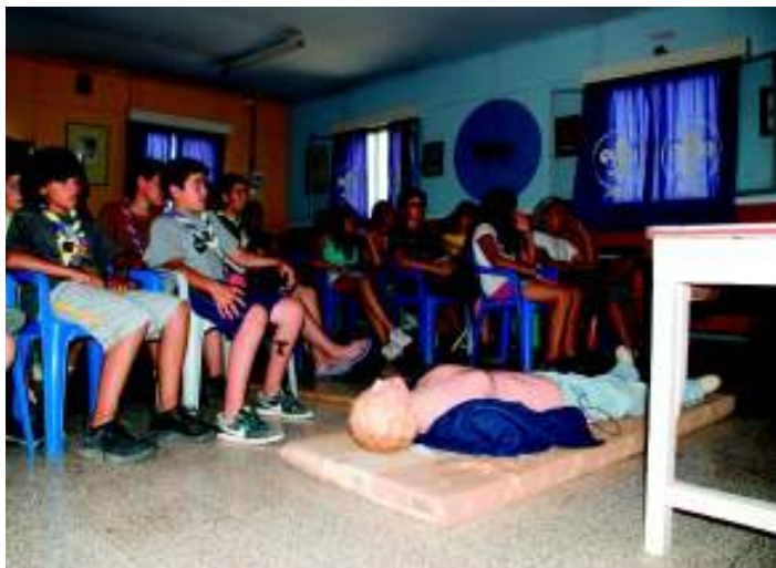
εκπαίδευση Πρώτες Βοήθειες