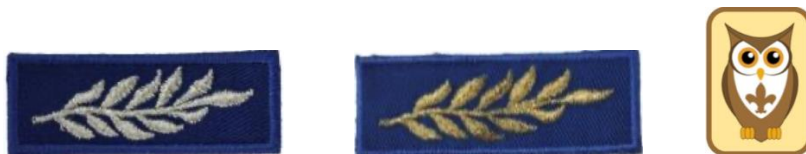
Η Αργυρή και η Χρυσή Δάφνη και το Πτυχίο Εξειδίκευσης

Στην Ομάδα Προσκόπων τα ψηλότερα στάδια είναι η Αργυρή Δάφνη και τέλος η Χρυσή Δάφνη , οι οποίες για να αποκτηθούν πρέπει να αποκτήσετε τα Τρίφυλλα και κάποια από τα Πτυχία. Υπάρχει ακόμη και το Πτυχίο Εξειδίκευσης που το αποκτάτε με τον ίδιο τρόπο.