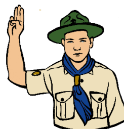
Εικόνα 1: ο προσκοπικός χαιρετισμός όταν φοράμε το μπερέ μας. Εικόνα 2: ο προσκοπικός χαιρετισμός όταν δε φοράμε μπερέ και Εικόνα 3: ο ειδικός χαιρετισμός που γίνεται μόνο κατά τη διάρκεια της Τελετής Υπόσχεσης ή ανανέωσης Υπόσχεσης με το χέρι σε ορθή γωνία.