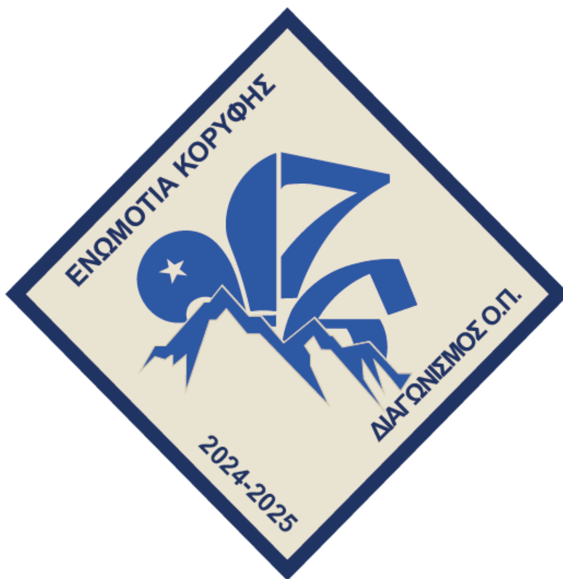
Το λογότυπο του διαγωνισμού μας